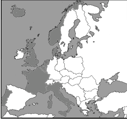
Mapa A .....

Mapy przedstawiają proces rozwoju terytorialnego NATO w Europie. Do zamieszczonych map dobierz odpowiadające im tytuły. W wyznaczone miejsca wpisz właściwe numery.